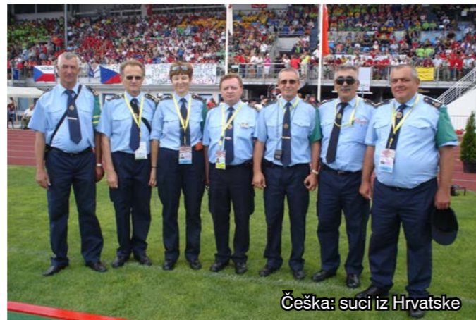
Češka: suci iz Hrvatske