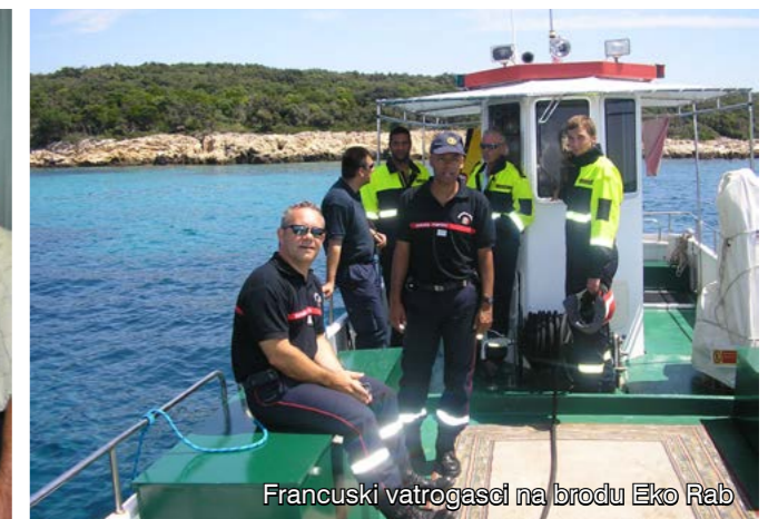
Francuski vatrogasci na brodu Eko Rab

Naposlijetku istaknimo kako su ovoga ljeta rapski vatrogasci ugostili i francuske kolege koji su ih posjetili u sklopu svoje dvotjedne ture po Primorsko-goranskoj županiji.