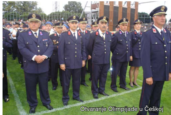
Otvaranje Olimpijade u Češkoj