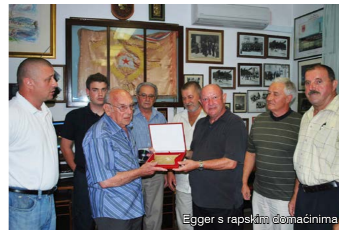
Egger s rapskim domaćinima

rapski vatrogasci primjenjuju u obrani od požara. Boravak na Rabu gosti su iskoristili i za obilazak šumskih putova u Kalifrontu i nastavnoga poligona zagrebačkoga Šumarskog fakulteta na Svetoj Mari. Također su posjetili i DVD Lopar, spomen-groblje žrtvama fašizma u Kamporu (na kojemu su pokopani i mnogi Slovenci), a razgledali su i sam