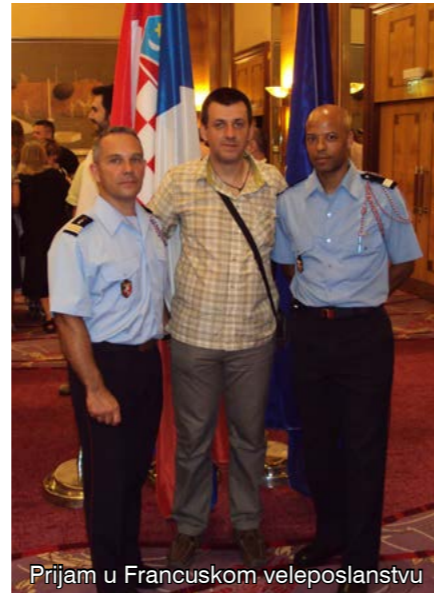
Prijam u Francuskom veleposlanstvu

Prema njihovom mišljenju, hrvatsko je vatrogastvo vrlo dobro organizirano, a u nekim je segmentima, ističu, otišlo i dalje od francuskoga. Tako su, primjerice, nakon posjeta MG-u, riječkoj tvrtki za proizvodnju vatrogasnih vozila i opreme, francuski gosti primijetili kako je tehnologija koju ta tvrtka primjenjuje znatno ispred francuske. - Mi u Francuskoj imamo strogo propisane standarde koji zapravo koče uvođenje novih tehnologija i dostignuća, što kod vas očito nije slučaj. Nadalje, za razliku od nas, pri intervencijama vi koristite