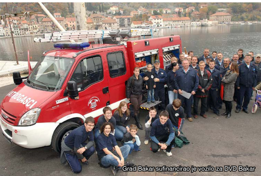
Grad Bakar sufinancirao je vozilo za DVD Bakar

-Što se tiče osnivanja DVD-a Kukuljanovo, pozdravljam volju i želju članova-osnivača tog društva da se aktiviraju u dobrovoljnom vatrogastvu. Samu odluku prepustio sam našoj Vatrogasnoj zajednici. Na pitanje je li Gradu Bakru, pored četiri postojeća društva, potrebno još jedno, može se odgovoriti na više načina. Ako u obzir uzmemo raspodjelu financijskih sredstava i ulaganja u to novo društvo, svakako da nije. Međutim, ako se pitamo je li postojećim DVD-ima potrebno još članova, tada je odgovor da. Dakle, ako imamo na umu činjenicu da smo obnovili vozni park postojećih društava koji će, usput rečeno, trebati otplaćivati godinama, čini mi se da, uz trenutačnu gospodarsku krizu, ulaganje u novo društvo, a radi se o više milijuna