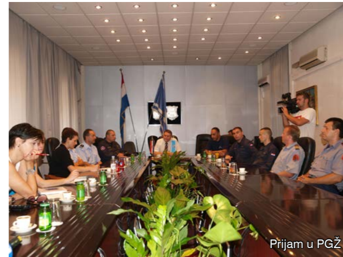
Prijam u PGŽ

Francuski su vatrogasci bili impresionirani viđenim pa nisu štedjeli riječi hvale. - Vrlo smo zadovoljni što smo imali priliku upoznati ovako dobru vatrogasnu organizaciju, kakva je u Primorsko-goranskoj županiji. Vidjeli smo riječku profesionalnu postrojbu koja je jako dobro opremljena i ustrojena. I vaši su DVD-ovi na visokoj razini, čak bolje organizirani nego u Francuskoj. Iznenađila nas je velika učinkovitost koju