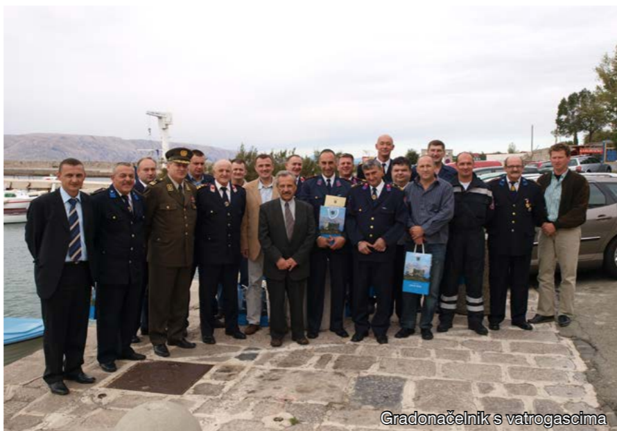
Gradonačelnik s vatrogascima

General bojnik Mate Obradović, zapovjednik protupožarnih namjenskih snaga Oružanih snaga RH rekao je pak kako su kanaderi letjeli u iznimno teškim uvjetima jer se nad cijelim područjem Senja nadvio gust dim, ali su, unatoč tome, odradili svoj posao. Istodobno, general bojnik Obradović podsjetio je i na činjenicu da od četiri dalekovoda jedan nije bio isključen što je nakon bacanja vodene bombe iz kanadera izazvalo eksploziju u kojoj, na sreću, nitko nije stradao. - To je propust, istaknuo je general bojnik, koji se nije smio dogoditi.