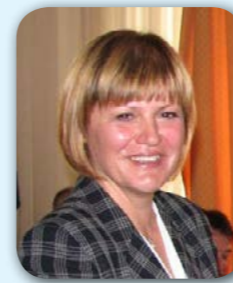
Piše: Vanda Radetić-Tomić