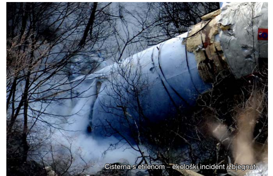
Cisterna s etilenom – ekološki incident izbjegnut

Kraj godine vrijeme je za sumiranje rezultata i najava za sljedeću godinu.