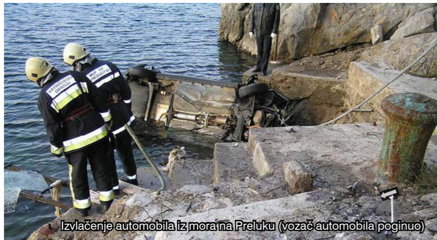
Izvlačenje automobila iz mora na Preluku (vozač automobila poginuo)

Budući da je izrazito turistički kraj, u Liburniji se (osobito u Opatiji), tijekom ljetnih mjeseci višestruko poveća broj ljudi koji tu borave. To je vatrogasnoj službi dodatni izazov jer se time povećava i opasnost od raznih nezgoda i nesreća.