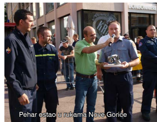
Pehar ostao u rukama Nove Gorice