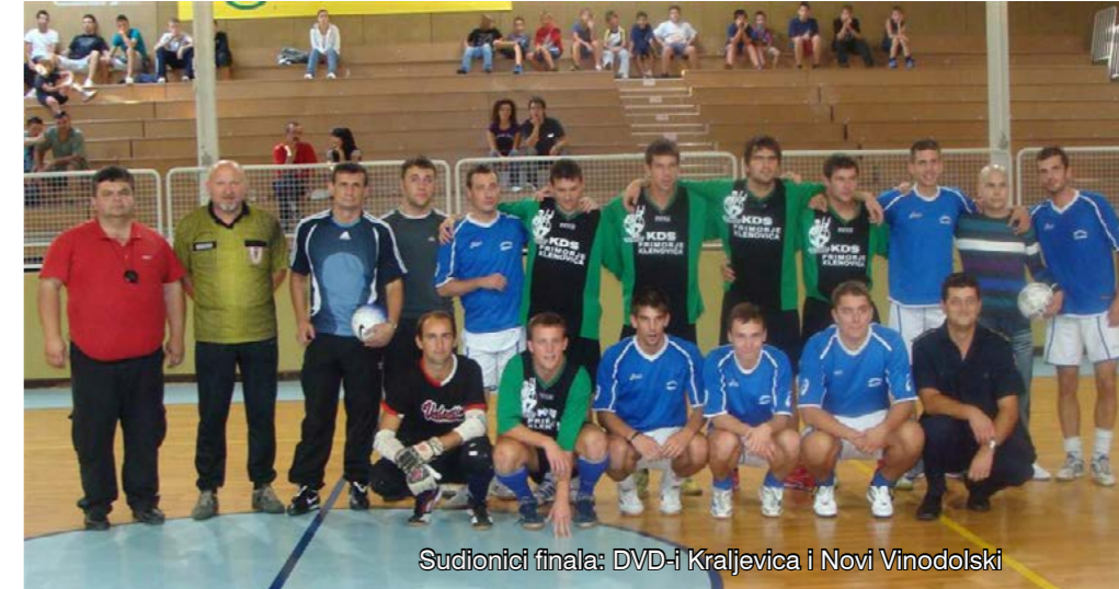
Sudionici finala: DVD-i Kraljevica i Novi Vinodolski