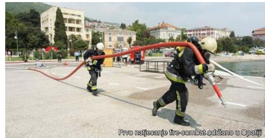
Prvo natjecanje fire-combat održano u Opatiji

Velika se pozornost posvećuje i osposobljavanju kadrova, kako profesionalnih, tako i dobrovoljnih. Liburnijski vatrogasci redoviti su polaznici tečajeva usavršavanja, a neki od njih i sami vode stručne seminare. Tako su, primjerice, opatijski časnici predavali zaposlenicima BINA-ISTRE, djelatnicima i gostima opatijskih hotela, učenicima osnovnih i srednjih škola,