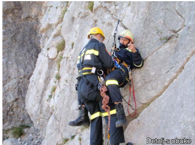
Detalj s obuke