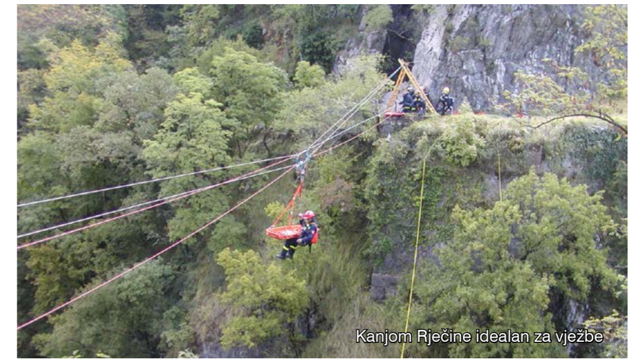
Kanjom Rječine idealan za vježbe

djeci iz vrtića... Pored toga, prvi put u Hrvatskoj organizirali su natjecanje u fire-combatu. - Stručno usavršavanje za liburnijske je vatrogasce imperativ jer djeluju na području koje to od njih zahtijeva.